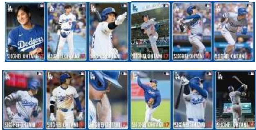
ポストカード(縦型)図柄例